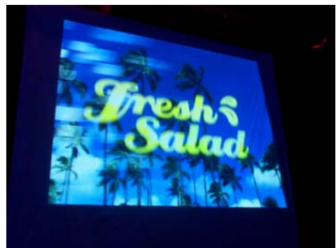
Een logo doet het altijd goed

Voor de rest is het leuk thematisch werk te maken. Dit kan werk zijn dat goed past bij een bepaalde muziekstijl. Je moet dan bijvoorbeeld denken aan iets met palmbomen bij club en iets technisch bij electro.