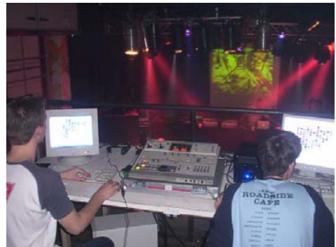
VJën met de makers van Pilgrim

Er is aardig wat VJ software op de markt. Probeer gewoon wat uit en kijk wat je het best bevalt. Ik ben toendertijd verliefd geworden op het programma Pilgrim. (Een programma wat overigens niet meer ondersteund / verkocht wordt.) Dit omdat het realtime 3D ondersteunde. Het voordeel daarvan is dat je live nog aan de objecten in de beelden kunt knoeien. Ook is de output resolutie zo hoog als je maar wilt (en krijg je dus vlijmscherpe beelden).