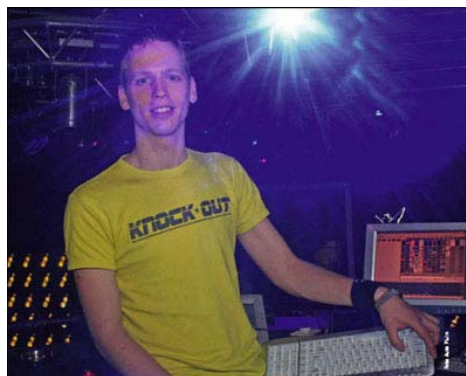
Een foto uit een lokaal magazine

Zodra men je eenmaal goed genoeg kent hoef je niet veel meer aan promotie te doen. Meestal gaat de reclame dan mond op mond en via de optredens die je hebt. Meestal zullen dezelfde organisatoren je wel weer opnieuw inhuren. (Tenminste, als ze tevreden over je zijn.)